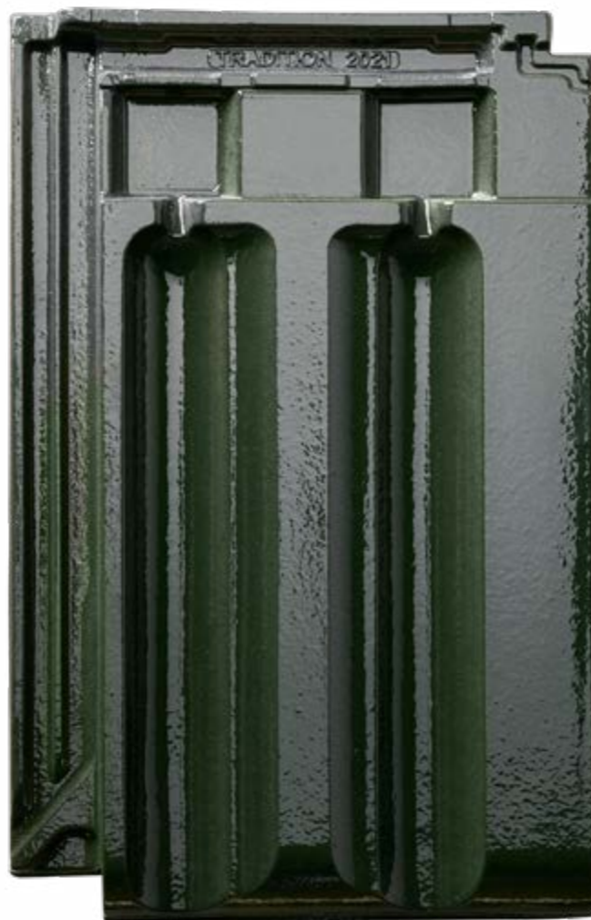
Tradition 2021 tannengrün

Der Tradition 2021 wurde vom IBS-Institut für Brandschutztechnik und Sicherheitsforschung Gesellschaft m.b.H. mit der Hagelwiderstandsklasse 4 (HW4) ausgezeichnet!