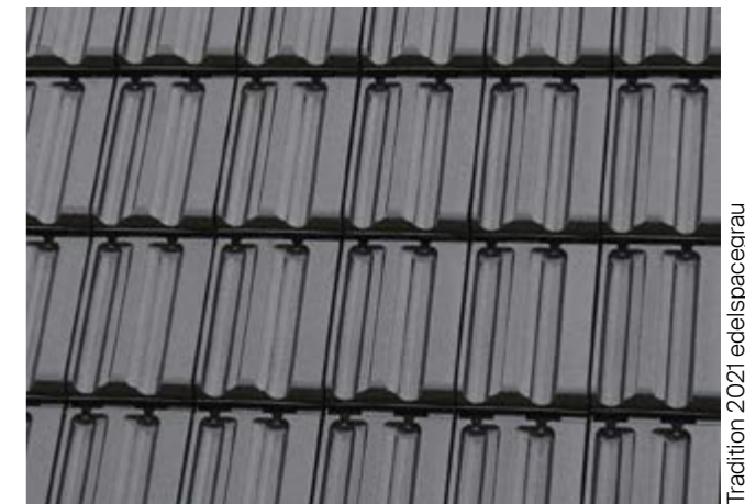
Tradition 2021 edelspacegrau