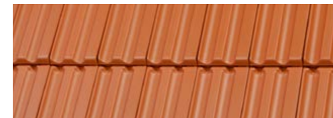
Z2 altrot, Reihe

Weiteres keramisches und nichtkeramisches Zubehör finden Sie unter www.dachziegel.de