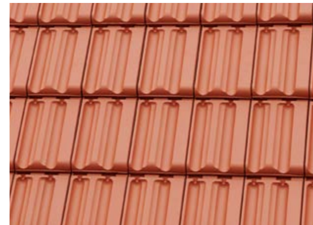
Tradition 2021 rotbraun

Avantgarde-Glasur: maronenbraun, vulkanswarz, bordeauxrot, tannengrün, marineblau