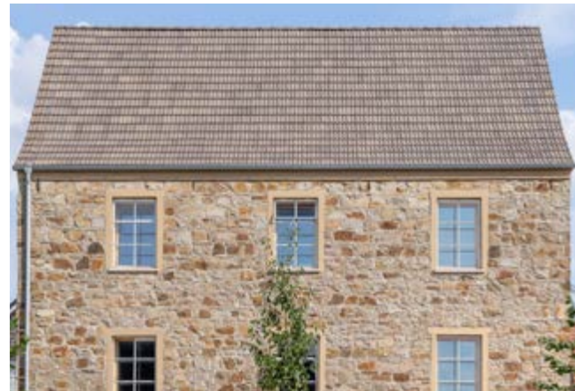
Z2 lichtgrau gedämpft