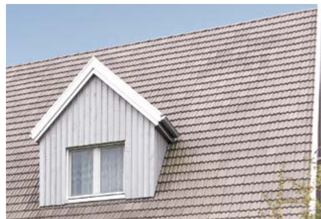
Z2 lichtgrau gedämpft