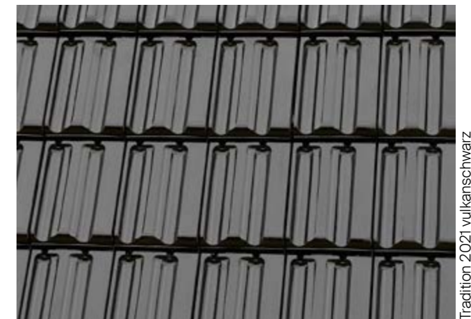
Tradition 2021 vulkanswarz