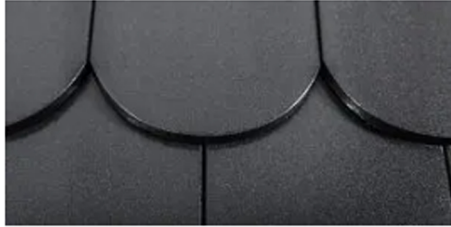
Voll im Trend: Glasierte Dachziegel in spacegrau

Der neue glasierte Farbton spacegrau der Collection Avantgarde wurde im Sommer 2017 auf dem weiterentwickelten Dachziegel J11v vorgestellt und erfreut sich großer Beliebtheit bei Kunden, die ihrem Dach ein besonderes Erscheinungsbild verleihen wollen. Ab sofort ist die attraktive Effektglasur spacegrau auch auf dem in Duderstadt produzierten 18x38 Biber Rundschnitt erhältlich.