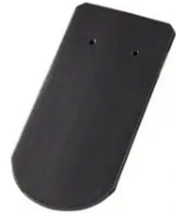
Biberschwanzziegel 18x18 Rundschnitt, spacegrau

Die neue Premium-Oberfläche spacegrau liegt voll im Trend. Mit ihrem ausdrucksstarken Glanzeffekt sorgt sie auf jedem Dach für Aufsehen. Der individuelle Tondachziegel mit dem gewissen Touch lässt sich sowohl bei anspruchsvollen Projekten der modernen Architektur, als auch für den exklusiven Einfamilienhausbau einsetzen. Je nach Lichteinfluss erstrahlt der Ziegel in einem tiefen Grau mit sanftem Glanz oder in elegantem, starkem Schwarz mit Diamantperleffekt.